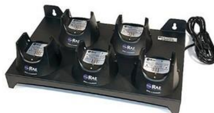
Csoportos akkutöltő 5 db műszer töltésére