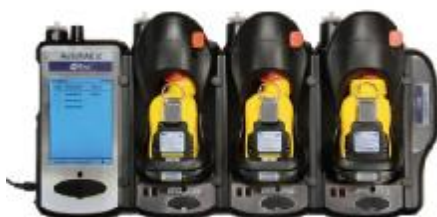
AutoRAE 2 Automatikus Teszt és Kalibráló rendszer