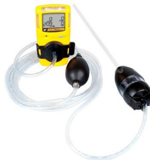
Kézi mintavevő szivattyú MC-AS01 Minta felszívására a műszertől távolabbi helyről, kpl. mintavevő tömlővel, csatlakozó adapterrel és kézi szivattyúval,