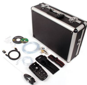
Deluxe készlet zárt terekben való beszálláshoz MC-CK-DL A műszert és a kalibráló gázt nem tartalmazza