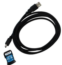
IR kiolvasó készlet GA-USB1-IR Az adatok kiolvasásához és a műszer konfigurálásához